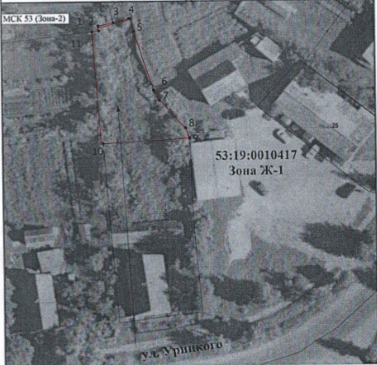
Схема расположения земельного участка или земельных участков на кадастровом плане территории