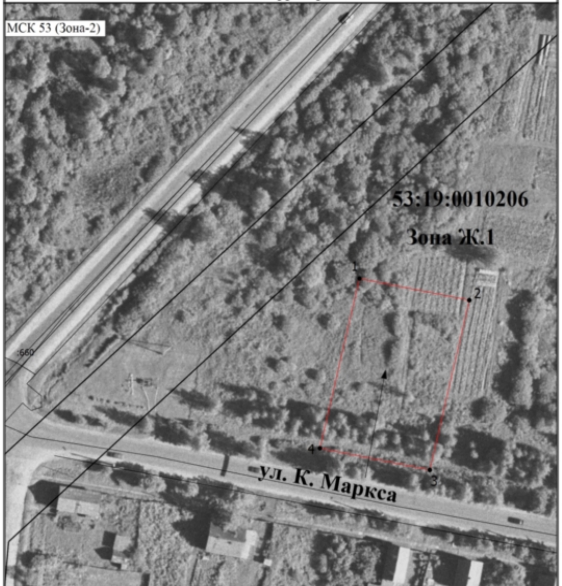
Схема расположения земельного участка или земельных участков на кадастровом плане территории