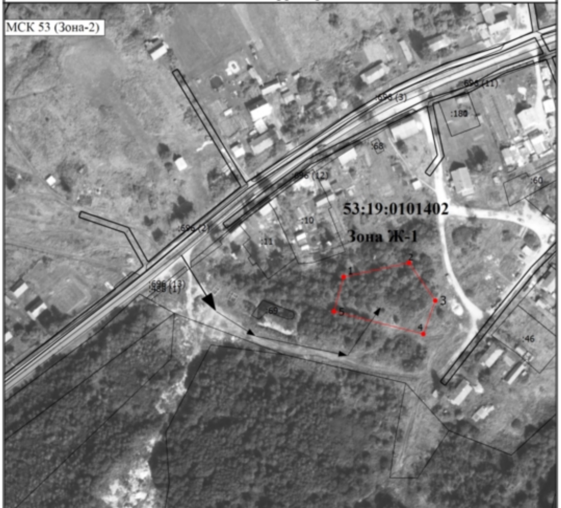
Схема расположения земельного участка или земельных участков на кадастровом плане территории